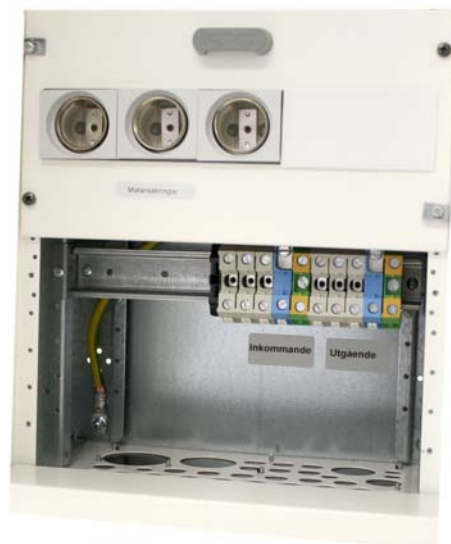
Skåpet gör anpassningen från transformatormätning till direktmätning enkel.

När kunden har en serviscentral byggd för strömtransformatormätning, men önskar maximalt 63A mätarsäkring, ska centralen modifieras för direktmätning. Numera finns ett mätarskåp för detta ändamål. Leverantör är Garo som har skåpet i sitt sortiment med E-nummer E 22 700 51, typbeteckning FLEXI-S-TD.