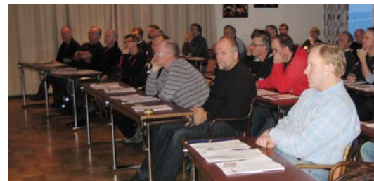
Intresset var stort från de församlade installatörerna, här i Sollefteå.