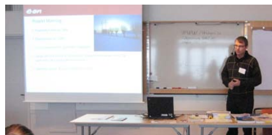
Bengt Thulin ger raka besked om rör.